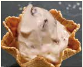
Rum & Raisin ラム レーズン レーズン 洋酒