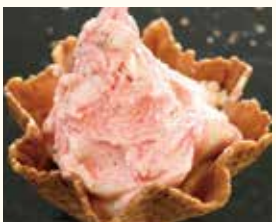
Fragola フラーゴラ イチゴ ミルクジェラート