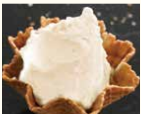
Latte ラッテ ミルクジェラート