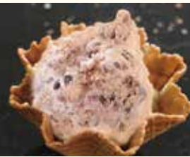
Azuki あずき あずき ミルク