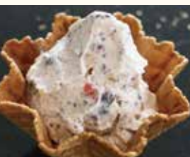
Cassata カッサータ ドライフルーツ チョコレートチップ