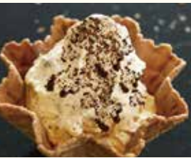
Tiramisù ティラミス エスプレッソ カステラ