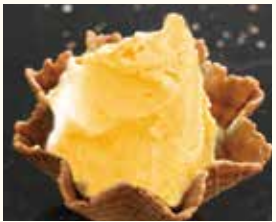
Arancia オレンジ オレンジ シャーベット